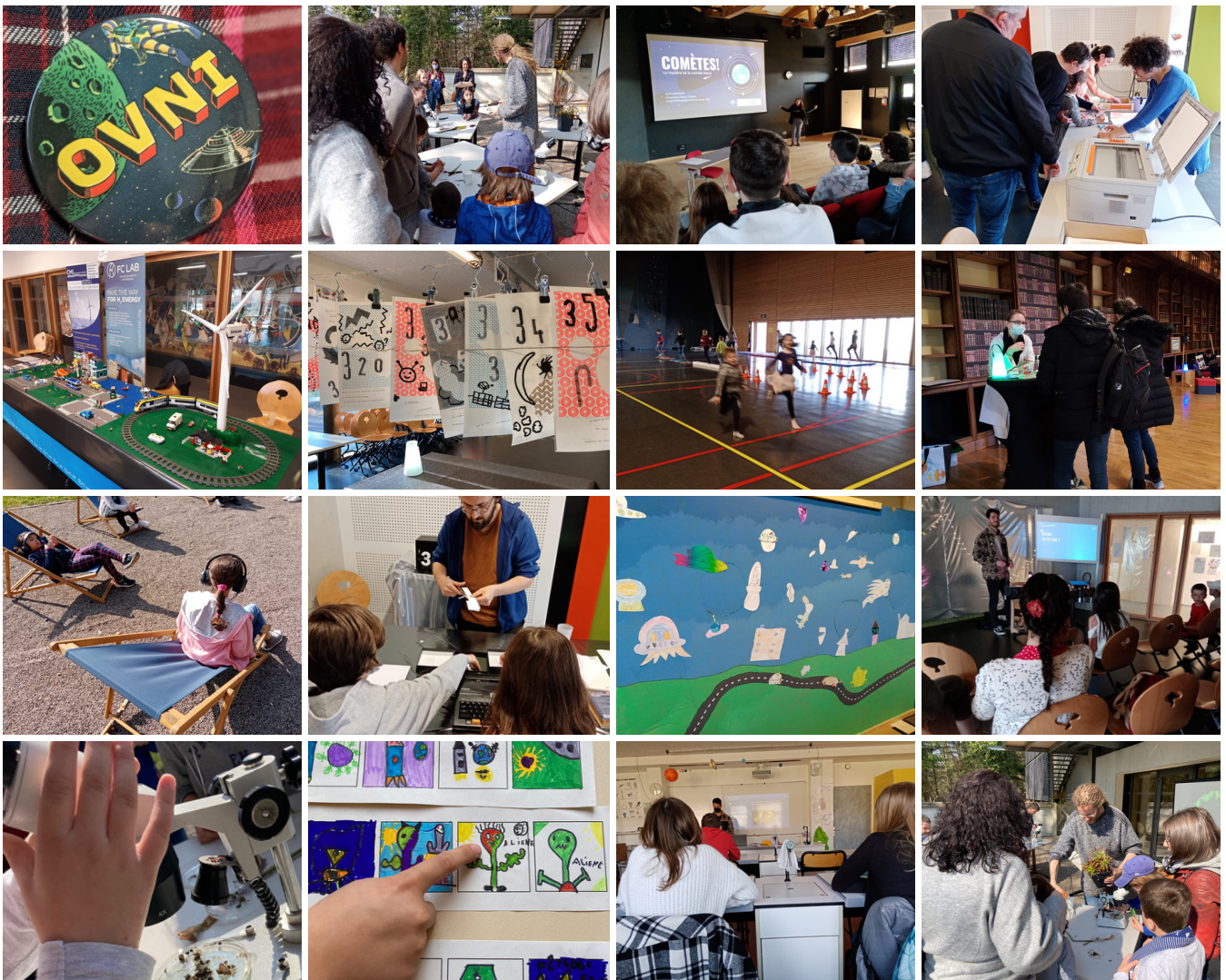
quelques photos des précédents OVNI

OVNI est une proposition itinérante et mobile sur le territoire Franc-Comtois jusqu'en 2023, pour échanger, partager et découvrir les sciences et les arts. Rencontres avec des chercheurs, actu des labos, ateliers et jeux, spectacle, installation artistique... et visites des sites d'accueil. Avec des interventions dans les établissements scolaires.